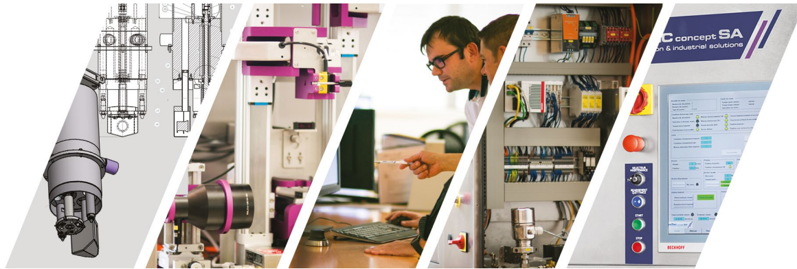
Fig. 1 : L'entreprise, de par ses nombreuses compétences, déploie ses activités dans les domaines de l'horlogerie, médical-pharma, biotechnologie, chimie, alimentaire, recyclage, ainsi que dans l'industrie en général.