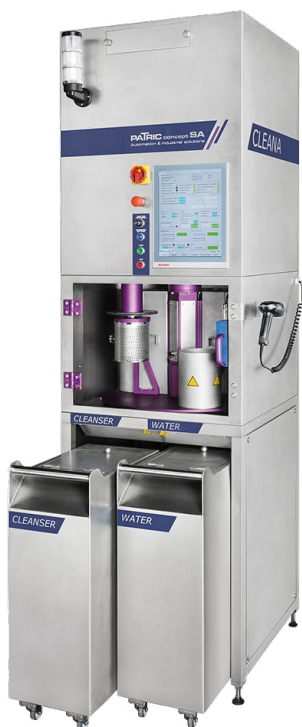
Fig. 3: La gamme Cleana est issue d'une demande d'un grand groupe actif dans le secteur du médical.

Initialement prévue pour le client à l'origine du projet, la machine est désormais proposée dans tous les secteurs d'activité.