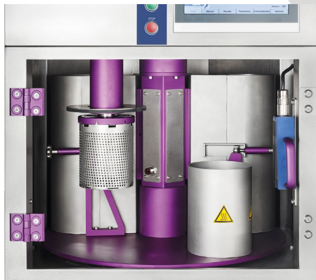
Fig. 4: Vue intérieure de la Cleana S.

En parallèle au développement et à la fabrication des machines Horiane et Cleana, Patric concept est sollicitée pour des développements spécifiques de solutions de lavage.